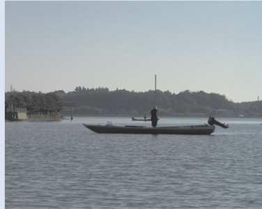
涸沼でのシジミ漁の様子

涸沼は、涸沼川などの河川水が流入するとともに、満潮時には那珂川、涸沼川から海水が遡上する関東唯一の汽水湖で、2015年にはラムサール条約の湿地に登録されています。平均水深2.1m、湖面積9.4km 2 の浅く小さな湖沼で、ヤマトシジミなどの漁場であるとともに、ヒメマイトンボなど希少動植物が生息しています。