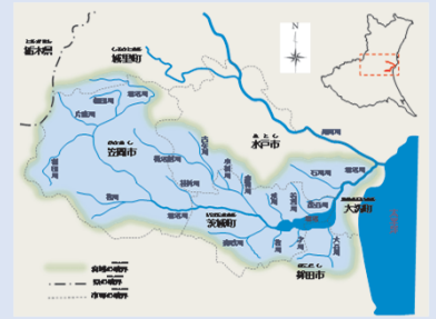
涸沼の位置と概略図